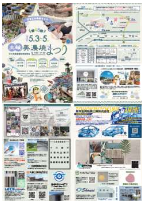
昨年のパンフレット

※Microsoft Word/PDF/Adobe Illustrator/Adobe Photoshop いずれかのデータで納入ください